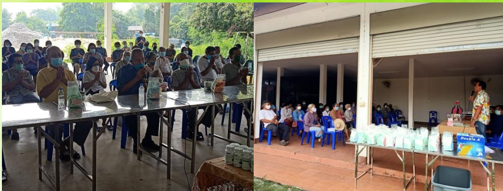
กิจกรรมรดน้ำดำหัวนายอำเภอเสนป่าตอง